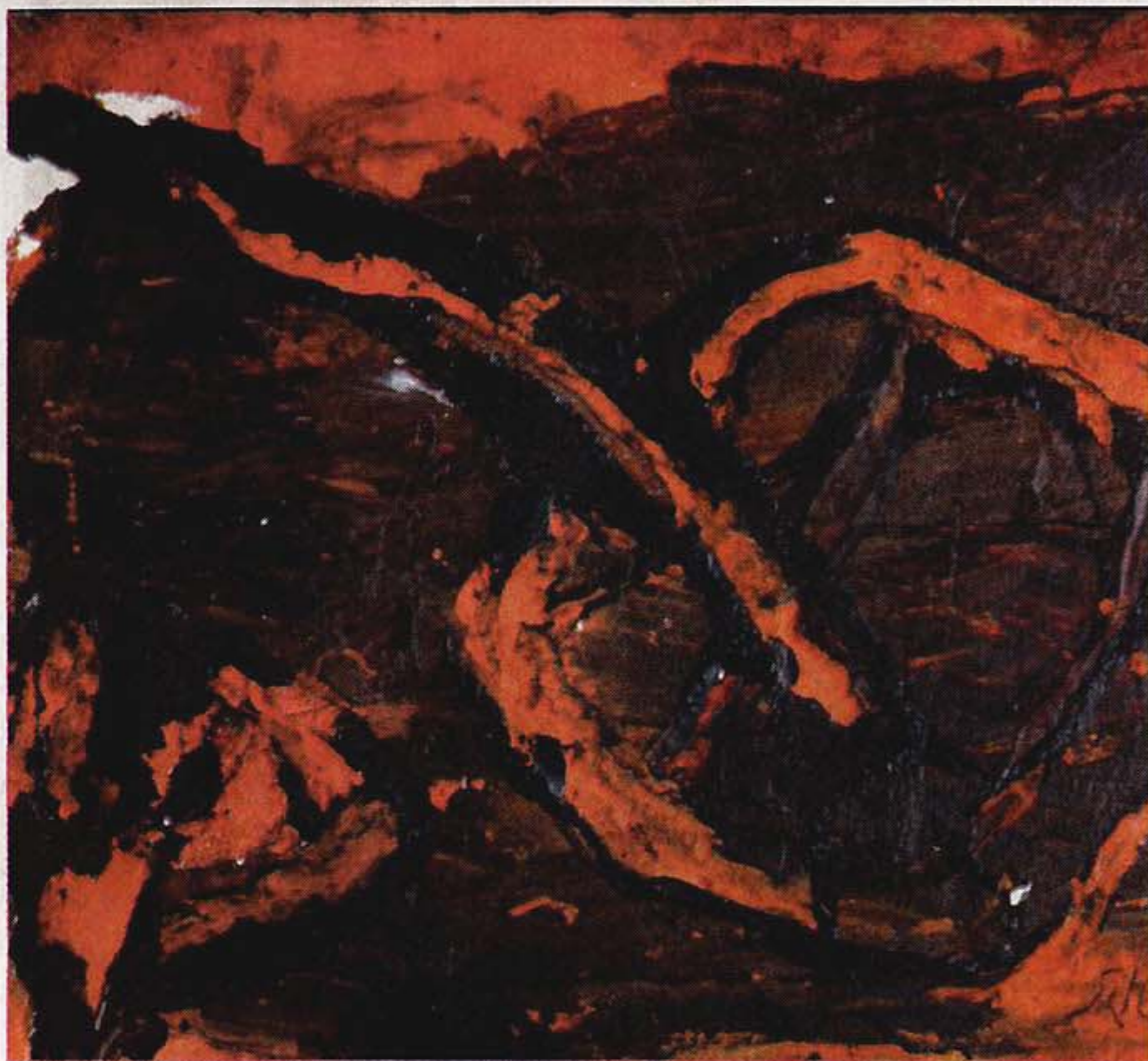
TERRANO. Obraz Emila Schumachera nazvaný Terrano z roku 1989.

Rozměrné olejomalby a kvaše významné osobnosti evropské abstrakce a informelu lze vidět v Chebu